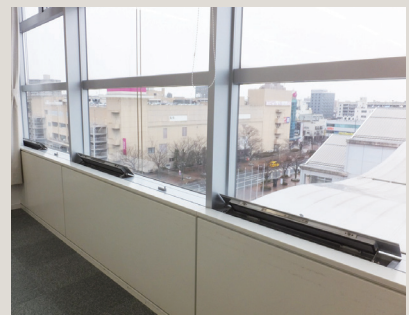
会議室は通気口を常に開けて、外気を取り入れています(第1会議室を除く)